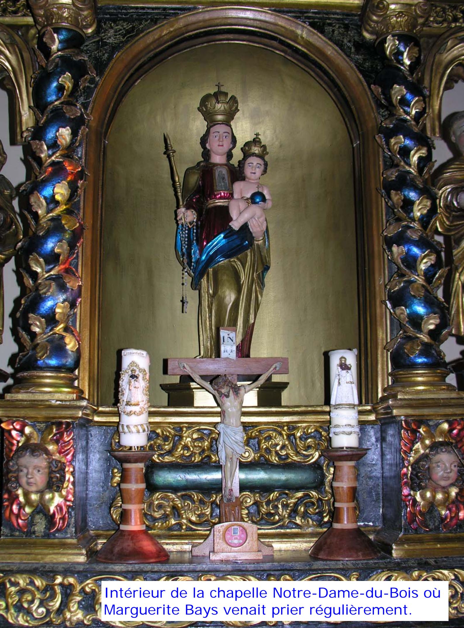
Intérieur de la chapelle Notre-Dame-du-Bois où Marguerite Bays venait prier régulièrement.